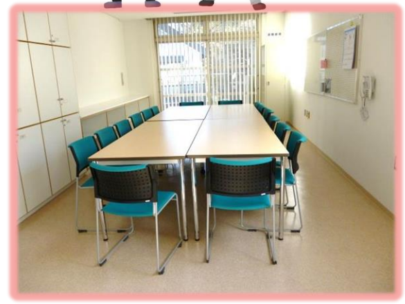
ボランティアルーム