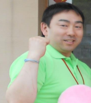
地域活動交流 コーディネーター くぼの