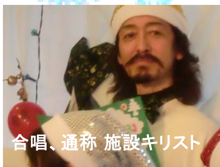
合唱、通称 施設キリスト