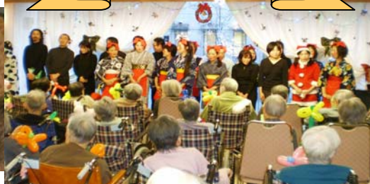
皆で歌いました【ふるさと】 館内にこだまする【ふるさと】 大きな声で歌いました【ふるさと】