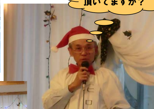
皆さん、楽しんで 頂いてますか？