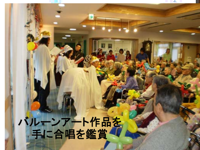
バルーンアート作品を 手に合唱を鑑賞