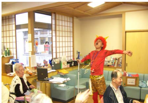
鬼は～外!福は～内!2月3日は厄払い