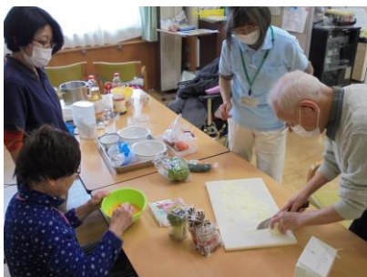
食事作り 全て手作りです