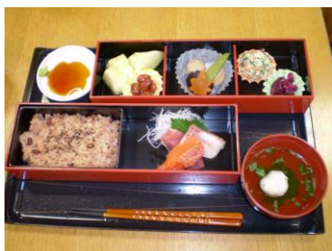
敬老週間お祝い膳

栄養バランスのとれた「美味しい」と好評の食事です。 おやつも毎回厨房のスタッフが手作りしています。