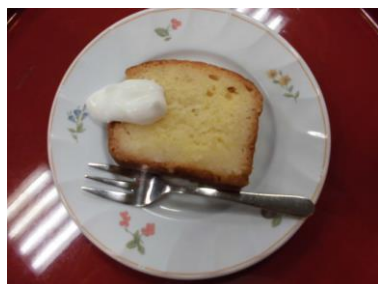
パウンドケーキ（日替わり）